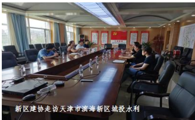
新区建协走访天津市滨海新区城投水利