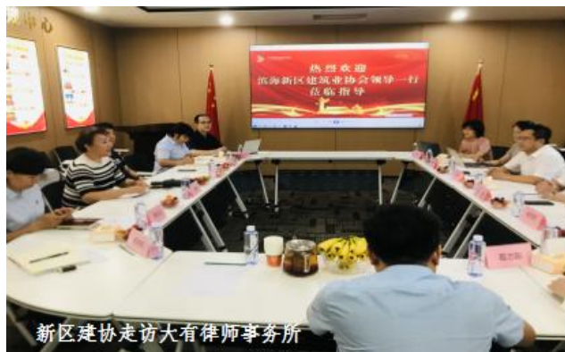
新区建协走访大有律师事务所

※7月份，新区建协继续落实走访会员企业工作，秘书处陆续走访了中交一公局第六工程有限公司、中建三局第三建设工程有限责任公司、天津市滨海新区城投水利工程有限公司、威海建设集团股份有限公司天津分公司、天津大成国际工程有限公司及天津大有律师事务所等6家会员企业。