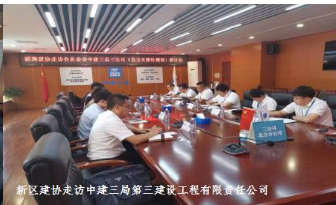
新区建协走访中建三局第三建设工程有限责任公司