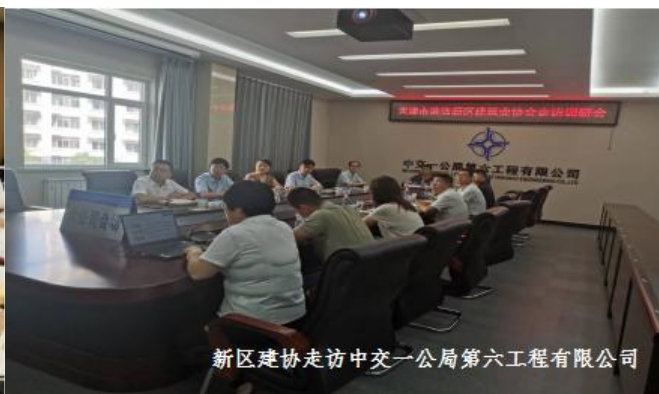
新区建协走访中交一公局第六工程有限公司