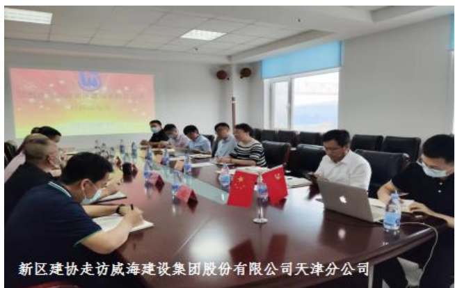
新区建协走访威海建设集团股份有限公司天津分公司